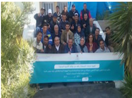
La Fondation aux côtés des associations de Souss Massa