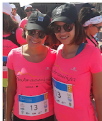
Deux raideuses courent pour la Fondation Zakoura à Dakhla